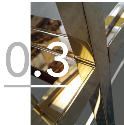
0.3 LABORATORIO FINITURE pulitura, satinatura, lucidatura