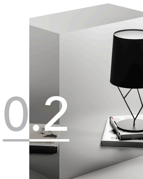
0.2 LABORATORIO COSTRUZIONE taglio, saldature, forature