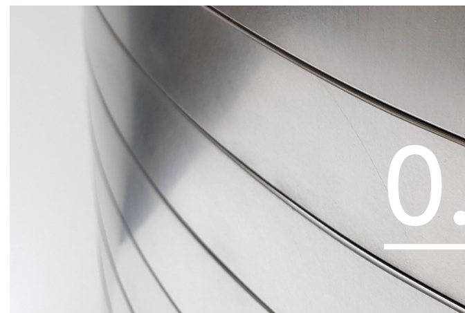
0.5 LABORATORIO DI ASSEMBLAGGIO montaggio ed incollaggio dei componenti